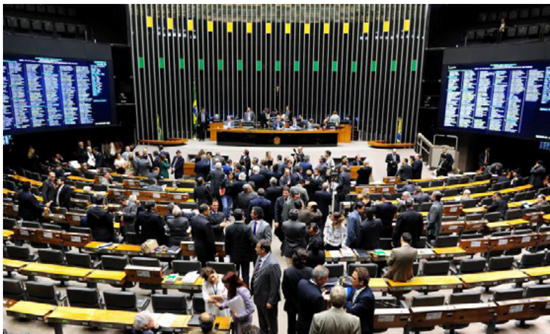
Senadores e deputados se dividem sobre o que é fake News e liberdade de expressão

Na sessão conjunta anterior, em 9 de maio, parlamentares bolsonaristas concordaram em adiar a votação da lei das saidinhas para impedir a votação dos dispositivos vetados na Lei de Segurança Nacional e ga-