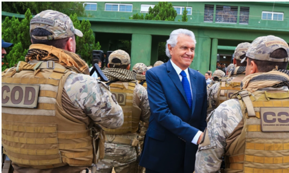
Governador Ronaldo Caiado ao lado dos policiais que participaram da Operação “Brasil É Um Só”

“Vocês deram essa contribuição em um momento emergencial”, enalteceu Caiado. Seguem no Rio Grande do Sul 12