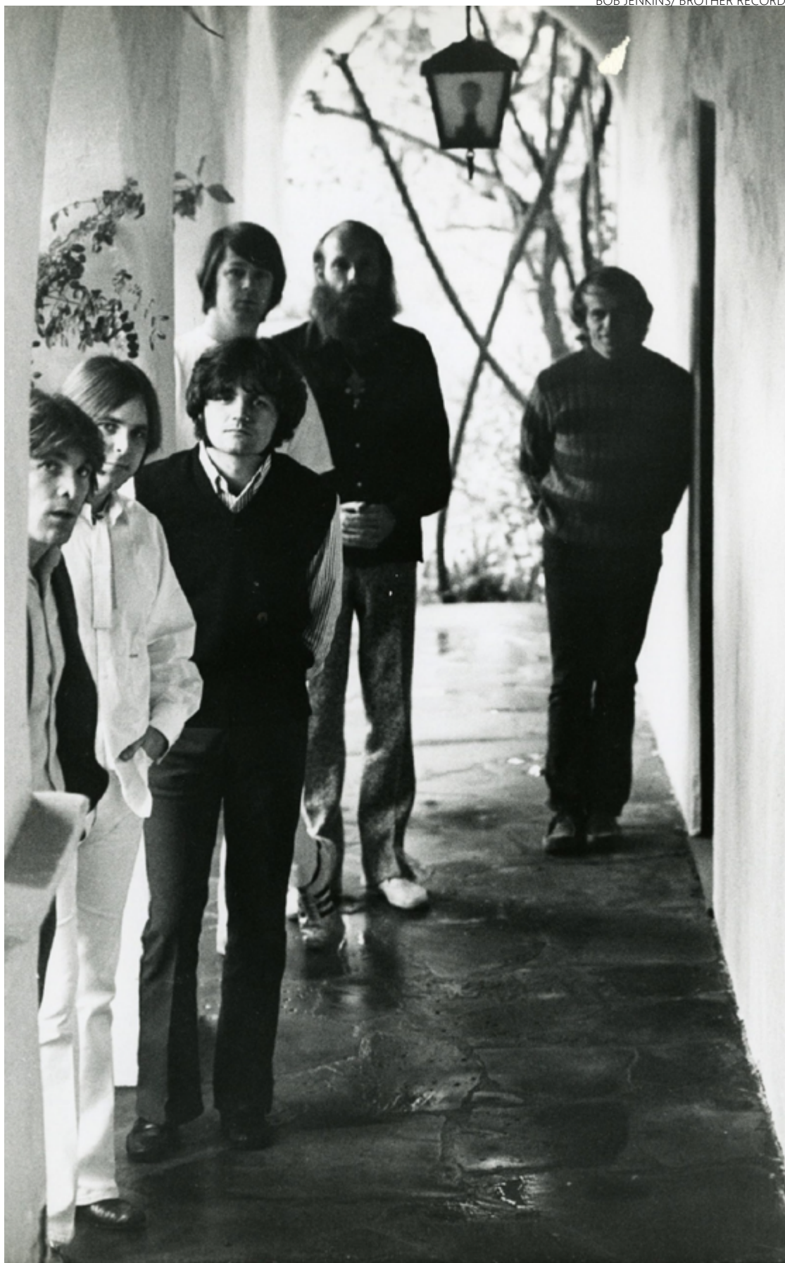
Grupo posa para foto promocional do disco “Sunflower”, lançado em agosto de 1970

Frank acredita que o documentário seja “mistura de tudo”. “É a mistura não só de história familiar, mas mistura de harmonias. Se você tirasse um elemento, não teria os Beach Boys”, conta à “Associa-