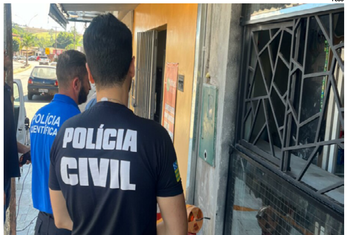
A operação Circuito Limpo contou com o apoio das Delegacias de Corumbá de Goiás e Pirenópolis, além do Núcleo de Polícia Técnico-Científica de Anápolis

Os três detidos foram encaminhados às delegacias locais e enfrentarão acusações de furto de energia elétrica, conforme previsto na legislação penal brasileira. Se condenados, po-