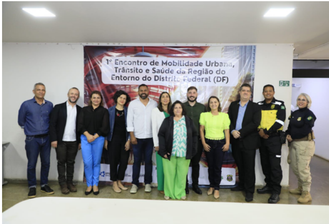
1º Encontro de Mobilidade Urbana, Trânsito e Saúde da Região do Entorno

"Já visitamos o sistema de transporte de Goiânia e agora estamos conhecendo o de Curitiba, no Paraná. Os dois são sistemas exitosos e queremos implementar experiências semelhantes na nossa