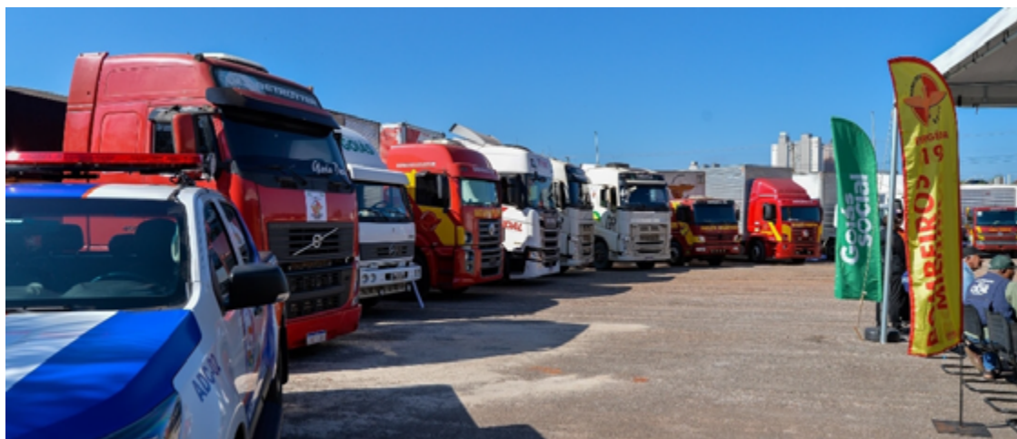
Goianos enviaram mais 251 toneladas em donativos para os gaúchos que enfrentam as enchentes

ladas de donativos para o Rio Grande do Sul – totalizando 1.076 toneladas com o comboio desta quarta-feira. As doações são da colaboração com a Organização das Voluntárias de Goiás (OVG), a Saneago, a Assembleia Legislativa de Goiás (Alego), a Central Única das Favelas de Goiás (CuFa Goiás), o Comando de Operações da Defesa Civil, além de empresas privadas como transportadora Rit Log, o Grupo José Alves, a Ypê Mineradora e a Caramuru Alimentos.