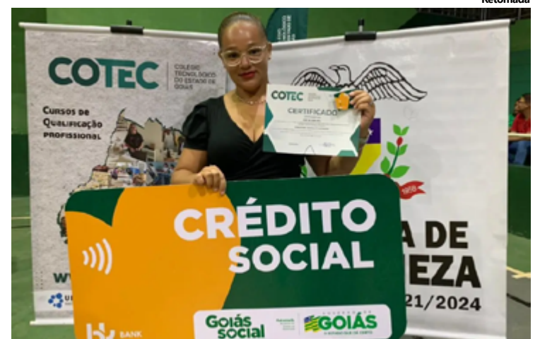
Beneficiários do Crédito Social devem preencher formulário de inscrição online para participar da seleção

Segundo ele a Secretaria da Retomada é uma das grandes parceiras do festival, que é o maior evento de música gratuita do Brasil, "em sua primeira edição em nosso estado". O empresário cita dados do Instituto Itaú que mostram que a cada R$ 1 in-