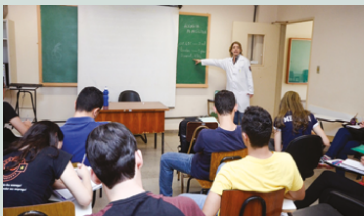
Retorno abrange graduação, pós-graduação e no Centro de Pesquisa Aplicada

A decisão foi tomada em concordância com o Sindicato dos Docentes das Universidades Federais de Goiás (Adufg-Sindicato), que informou oficialmente o fim da greve no início desta semana. O plebiscito eletrônico organizado pelo sindicato contou com a participação de 1.549 votantes, dos quais 820 se manifestaram a favor do fim da greve, 720 votaram pela continuidade, e houve 9 abstenções. A Adufg-Sindicato ressaltou que todos os