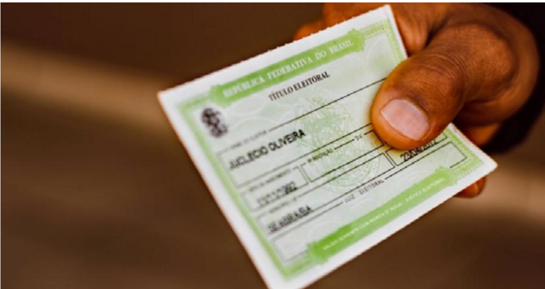
Desde a reabertura do cadastro eleitoral em novembro de 2022, 60.912 pessoas transferiram seu título da capital do país para outros estados