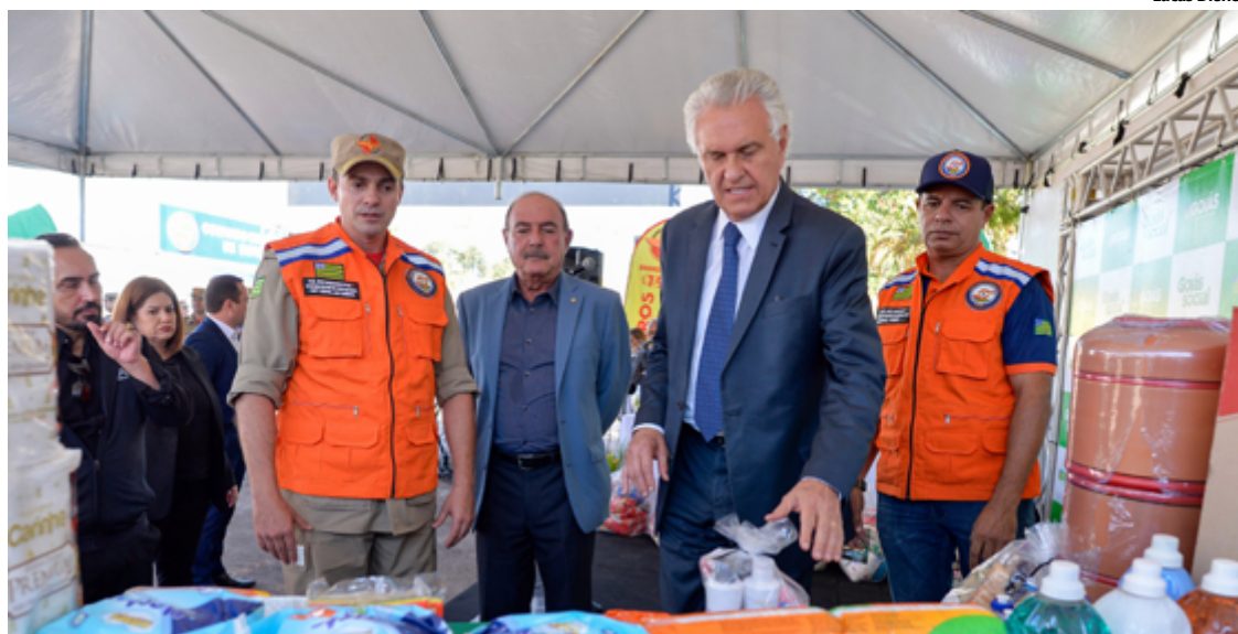
Goiás encaminha mais 251 toneladas em donativos para o Rio Grande do Sul

Goiás já havia enviado 825 toneladas de donativos para o Rio Grande do Sul – totalizando 1.076 toneladas com o comboio desta quarta-feira. As doações são da colaboração com a Organização das Voluntárias de Goiás (OVG), a Saneago, a Assembleia Legislativa de Goiás (Alego), a Central Única das Favelas de Goiás (Cufa Goiás), o Comando de Operações da Defesa Civil, além de empresas privadas como transportadora Rit Log, o Grupo José Alves, a Ypê Mineradora e a