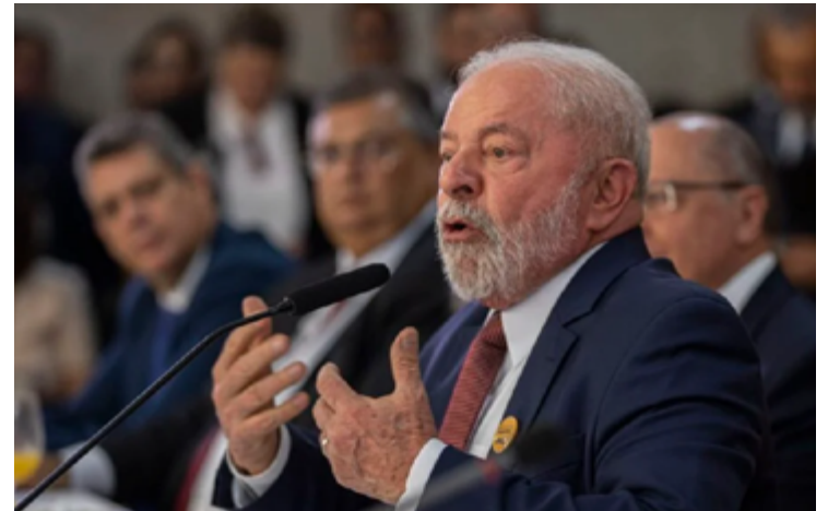
Lula da Silva: popularidade diminui desde a posse, em 2023