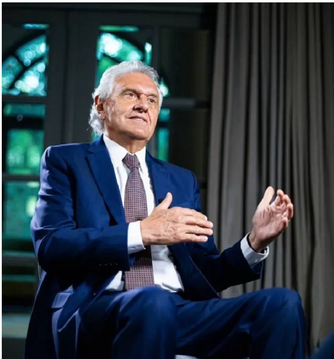
Ronaldo Caiado: aparição na TV, em rede nacional, para tornar-se conhecido do eleitorado brasileiro

Caiado aparece em cena gravada no heliponto do Palácio Pedro Ludovico. O texto acrescenta outro trecho no qual o goiano exalta as ações de seu governo na segurança pública. “Nossa polícia entra