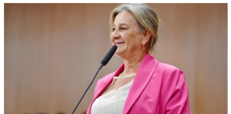
Dra Zeli: solidariedade ao povo gaúcho