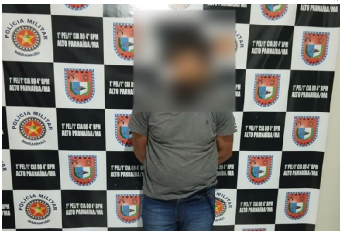
A ação coordenada entre as Polícias Civil e Militar de Balsas/MA e o GIH de Novo Gama foi essencial para o sucesso da captura.

aos ferimentos, enquanto a outra mulher conseguiu escapar sem ser atingida. Diante da gravidade dos crimes, a autoridade policial responsá-