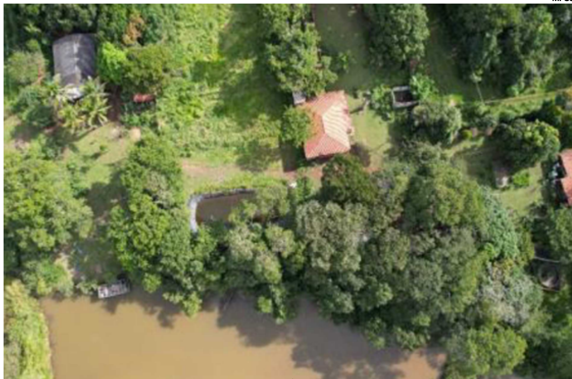
A acusação é de ocupação e intervenção irregular em Área de Preservação Permanente (APP) no Córrego Capitão do Mato, um afluente do Rio Palmital, cujas águas abastecem o município