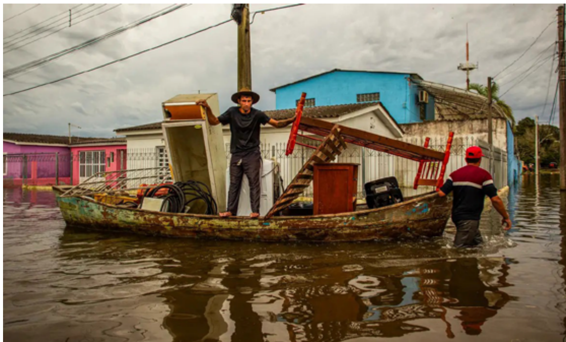
Pesquisa revela situação preocupante no Rio Grande do Sul, onde as chuvas deixaram diversas cidades submersas

O levantamento investigou, por exemplo, se existem medidas preventivas no Plano Diretor e na Lei de Uso e Ocupação de Solo. Também foi observado se existe uma lei específica para medidas de combate às tragédias climáticas, um plano municipal de redução de riscos, um mapa das áreas vulneráveis, um programa habitacional para realocação da população que vive nesses locais e um plano de